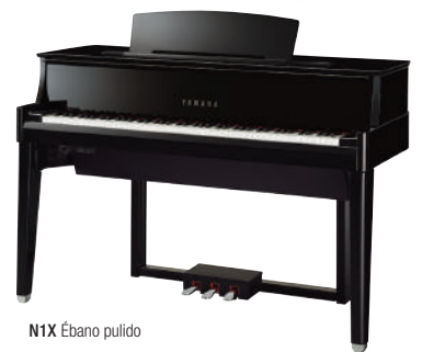
N1X Ébano pulido

Toca junto a tus canciones favoritas de la biblioteca musical de tu móvil o tablet, gracias al receptor Bluetooth, y utiliza la app "Smart Pianist" para controlar las funciones del N1X mediante tu iPhone o iPad.